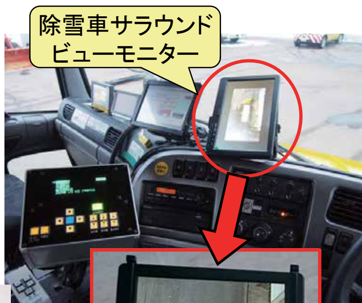
除雪車サラウンド ビューモニター